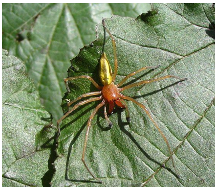
Zápřednice jedovatá – sameček