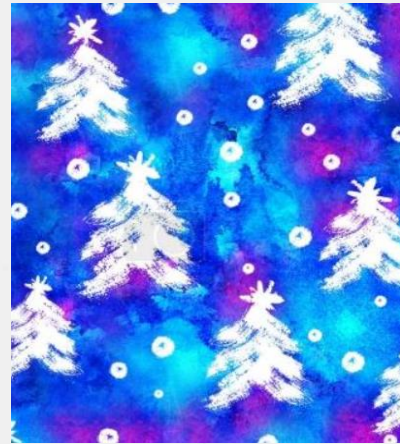
Lily Svobodová, 5. třída