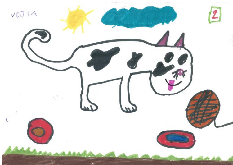
Kotě: Vojtěch Bracek, 3. třída