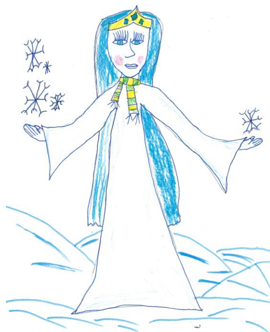
Zimní zahrada: Matyáš Plch, 5. třída